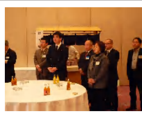
懇親会参加者も 120名と 今年も沢山参加して頂き ました。 料理も沢山大満足！！