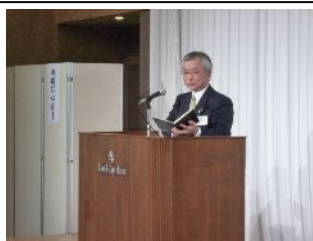
工藤会長の挨拶。 倫理法人会のご紹介と ご自身の実践をお話下さい ました。

今年の北上市倫理経営講演会も大盛況のうち終了することが出来ました。 お手伝い頂きました皆様ありがとうございます！！