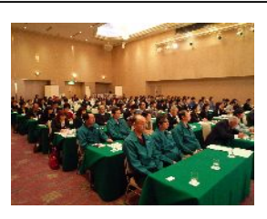
こんなに多くの来場頂き ました。 皆さま真剣に講話を聴いて 下さいました。