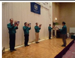
岩手県南青果市場の皆さまの 素晴らしい朝礼実演！ 来場者さまからも当社でも この朝礼を取入れたいとの声！