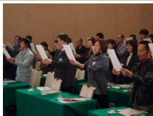
7アクトを全員で、 声高らかに唱和致しました。 暗唱できるように頑張り ましょう！！